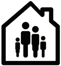
Оставайтесь дома Самоизоляции