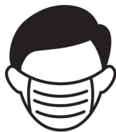
Vi Masken ose Mbulo Fytyren