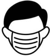
Maska taxın və ya Üz örtüyü